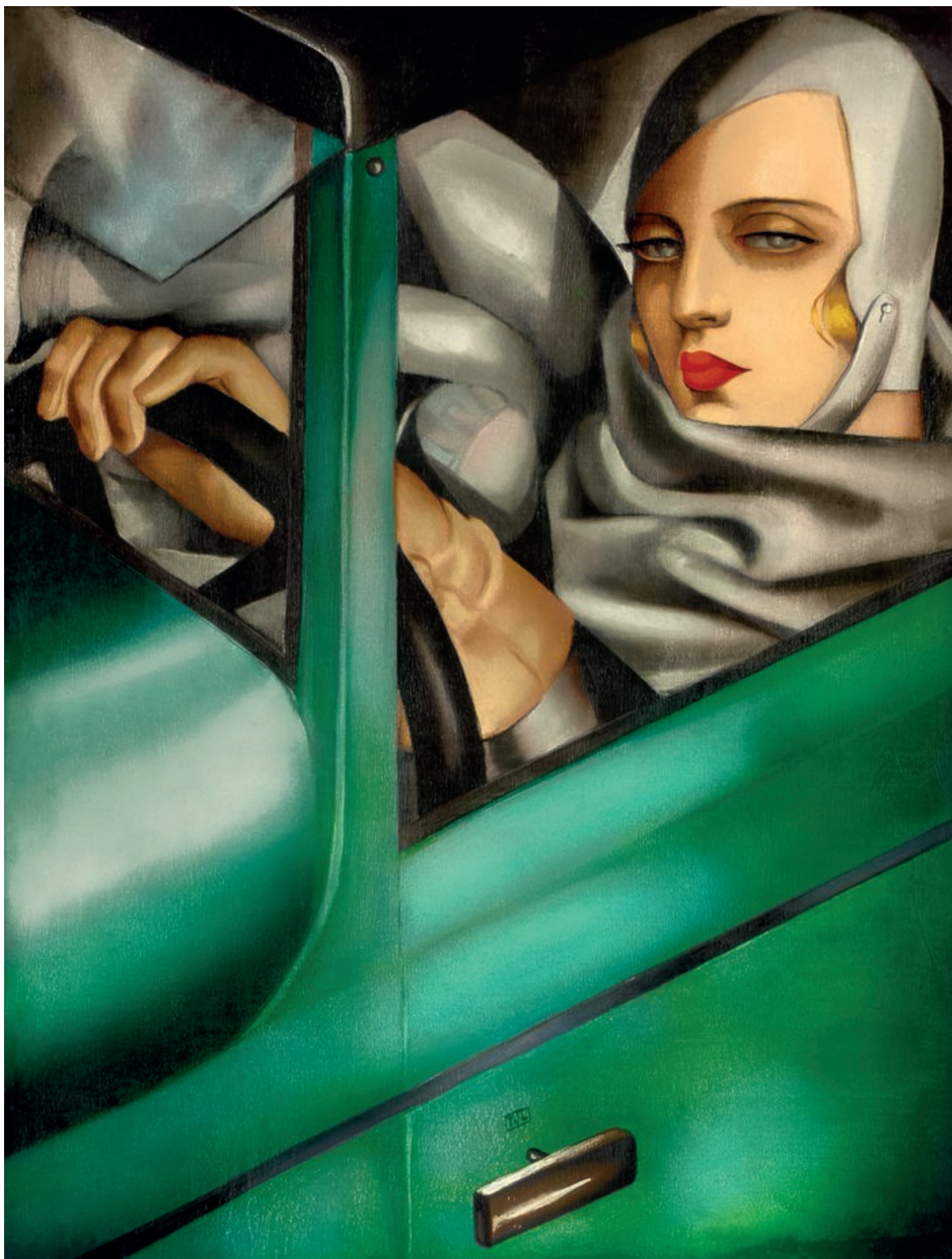
Autoportret w zielonym bugatti, 1929, olej na desce, 35 × 27 cm Self-Portrait in the Green Bugatti, 1929, oil on board, 35 × 27 cm