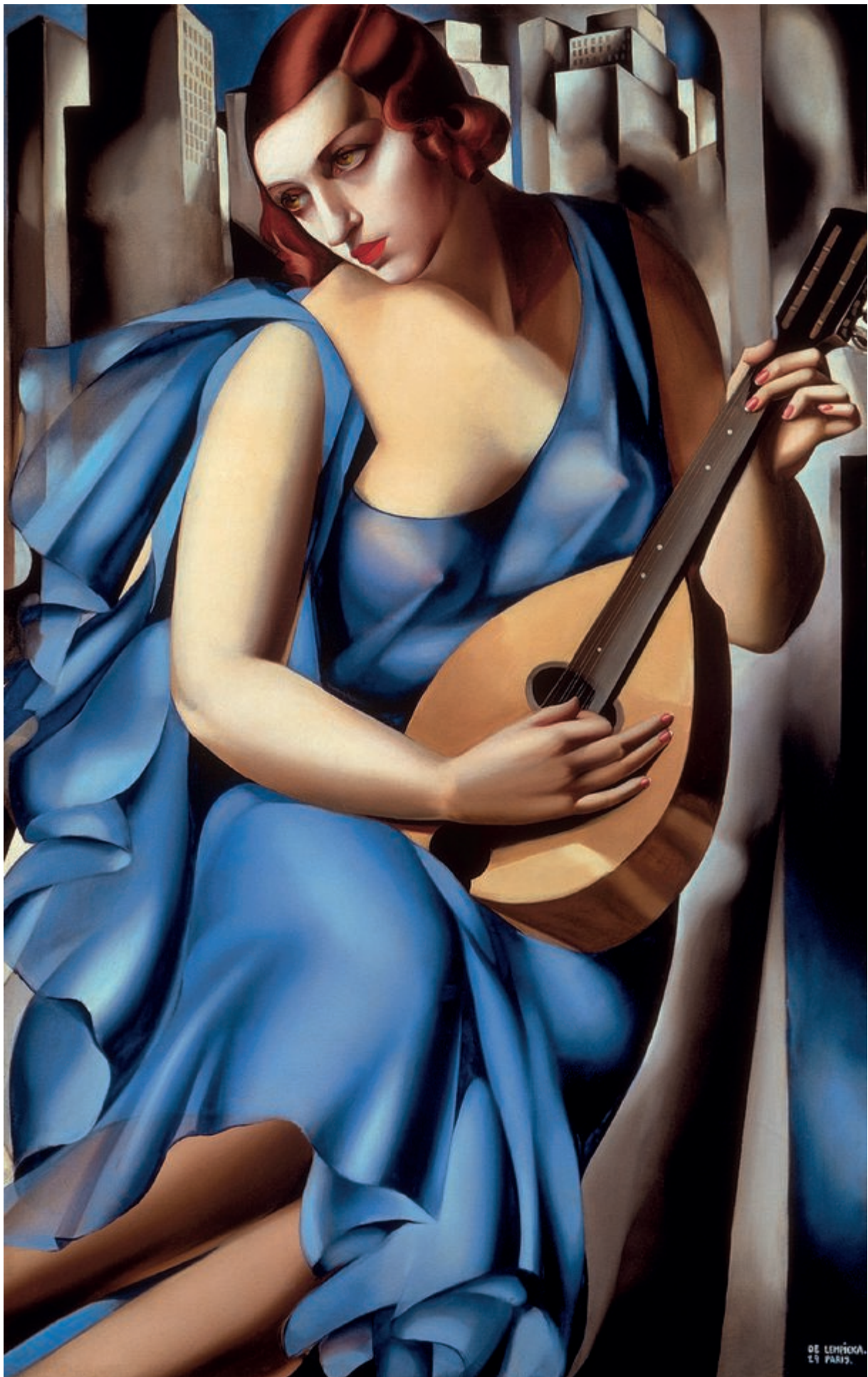
Muzykantka , 1929, olej na płótnie, 116 × 73 cm The Musician , 1929, oil on canvas, 116 × 73 cm