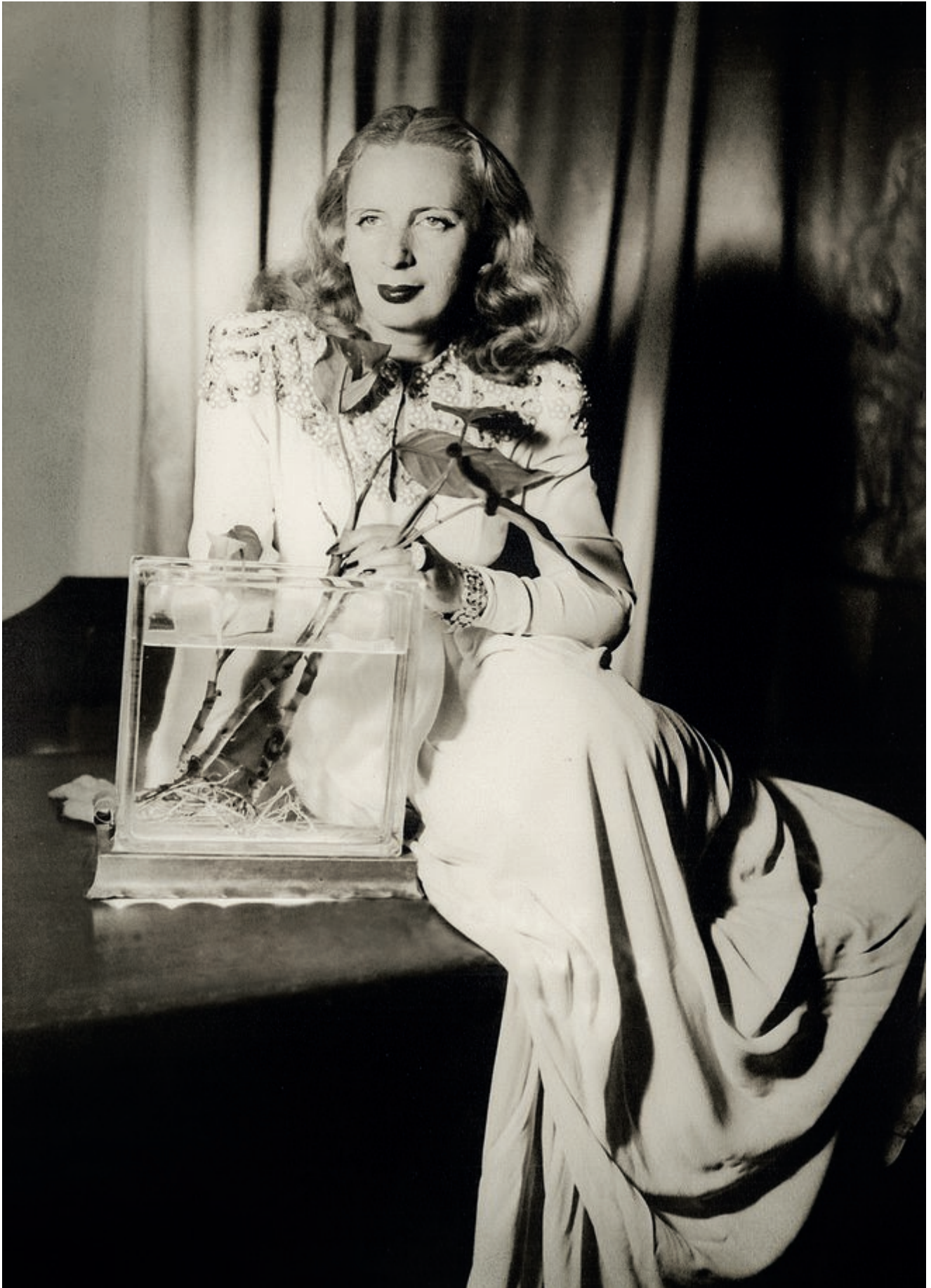
Tamara Łempicka w swoim nowojorskim apartamencie, 1954 Tamara de Lempicka in her New York apartment, 1954